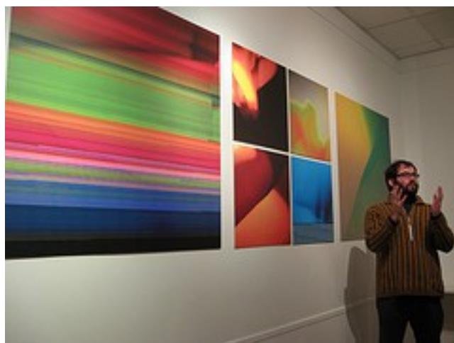
It's all about lovedu 29 avril au 24 mai 2008 galerie ooblik Lyon