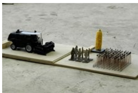
maquette de Faucheurs Fauchés

http://lesfaucheursfauches.over-blog.com/