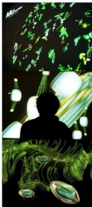
Main verte et Mμ_herbier de Catherine Nyeki/ Marc Denjean